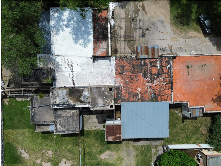
Techos del conjunto