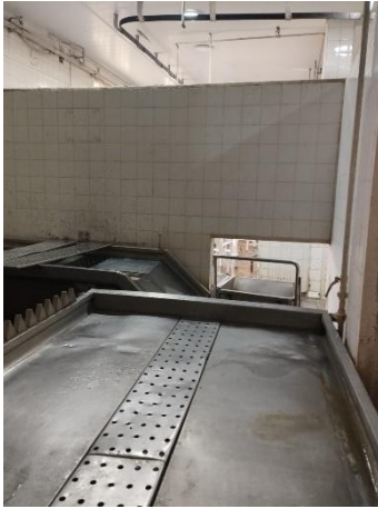
Sala viseras verdes