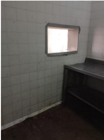
Sala de limpieza de cabezas