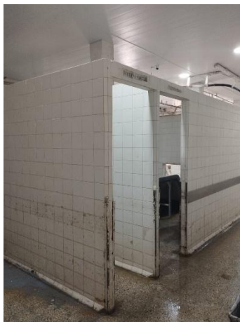
Sala viseras rojas