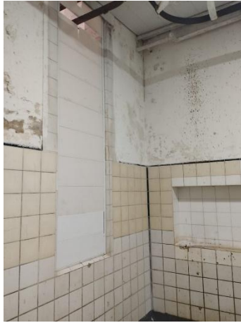
Espacio de colgado de media res