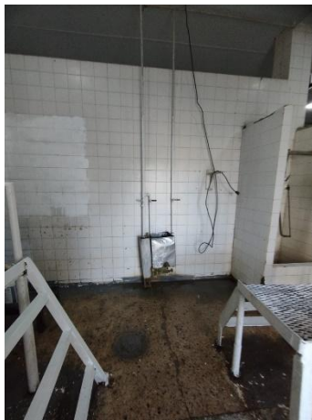
Espacio de manipulación