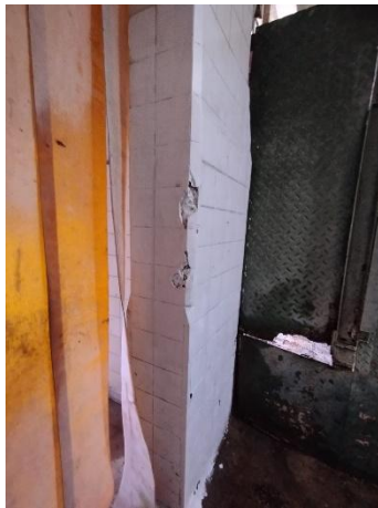
Ingreso de ganado

Se conforma de 435 m 2 cubiertos, que aúnan la playa de faena, salas de subproductos (limpieza de cabezas, viseras verdes y rojas), dos lavaderos de botas y manos, cámaras frigoríficas, pasillo de circulación, depósito y zona de despacho. En este sector nos encontramos con la presencia del tanque de reserva.