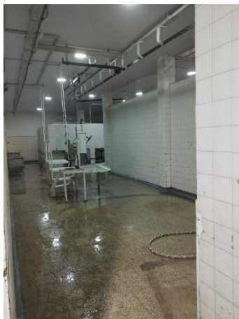
Espacio de faena